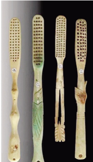
图为明代牙刷(资料图)