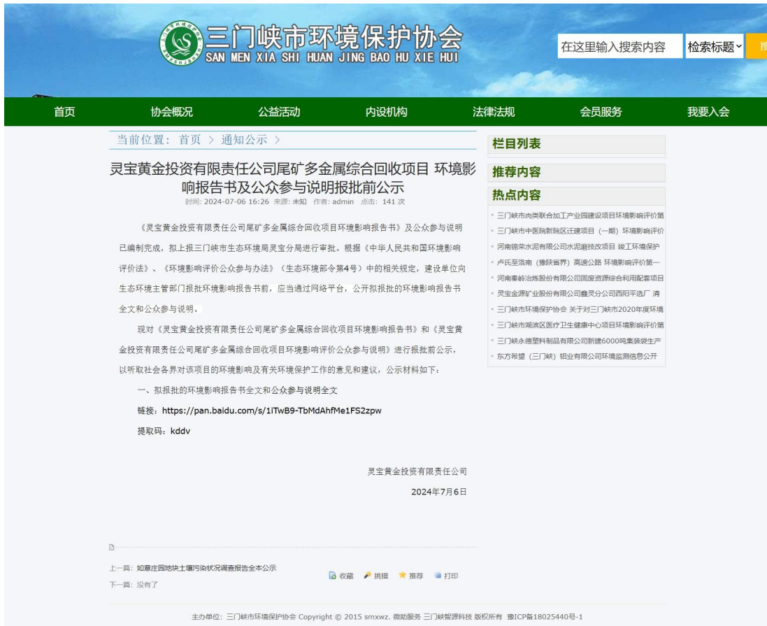
图 8.2-1 报批前公示截图